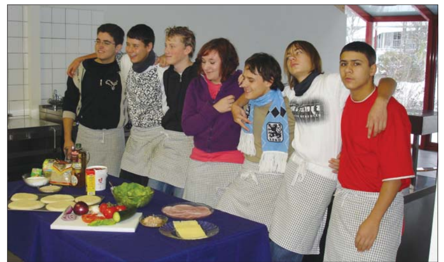
Gesunde Lebensmittel zubereiten und präsentieren – viel Spaß hatten dabei die Schülerinnen und Schüler Albrecht-Schnitter-Berufsschule am bayerischen Gesundheitstag