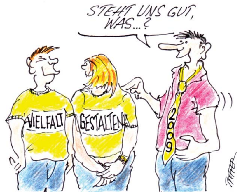
Ein Cartoon von Hubert Pfeffer