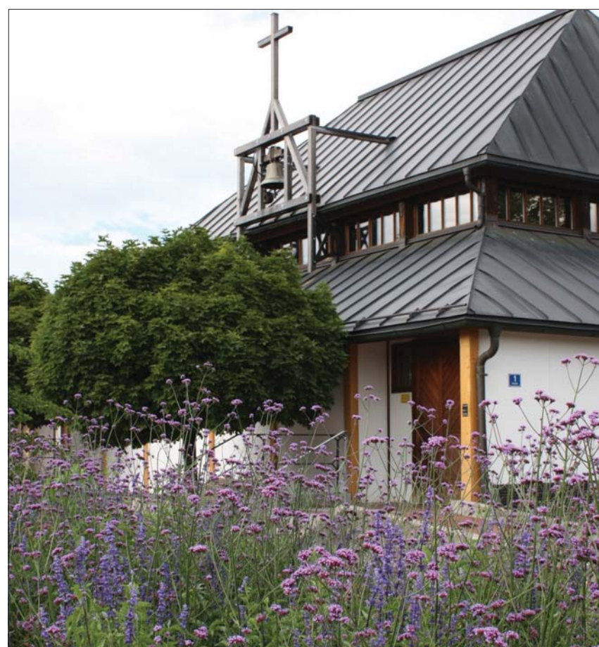
Bunte Vielfalt herrscht im Sommer auf dem Blumenbeet vor der Martinskirche

Wer den Jahresbericht nicht mit dieser Aussendung erhalten hat, kann ihn gern bei uns bestellen oder auf unserer Homepage unter www.herzogsaegmuehle.de als pdf kostenlos herunterladen.