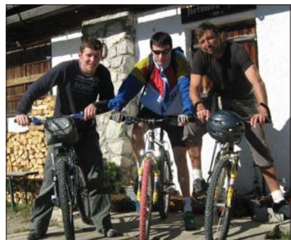
Von der Alpenvereinshütte aus konnte man noch aufwärts fahren: über 1900 Meter mit dem Fahrrad war die Herausforderung