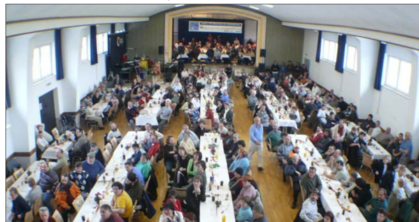
Die vollbesetzte Peitinger Schloßberghalle beim Jubiläum

zender des Werkstatrates an und berichtete ausführlich über zahlreiche Aktivi-