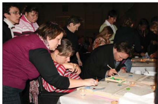
Auf den vorbereiteten Tonplatten konnte jeder eine Spur hinterlassen