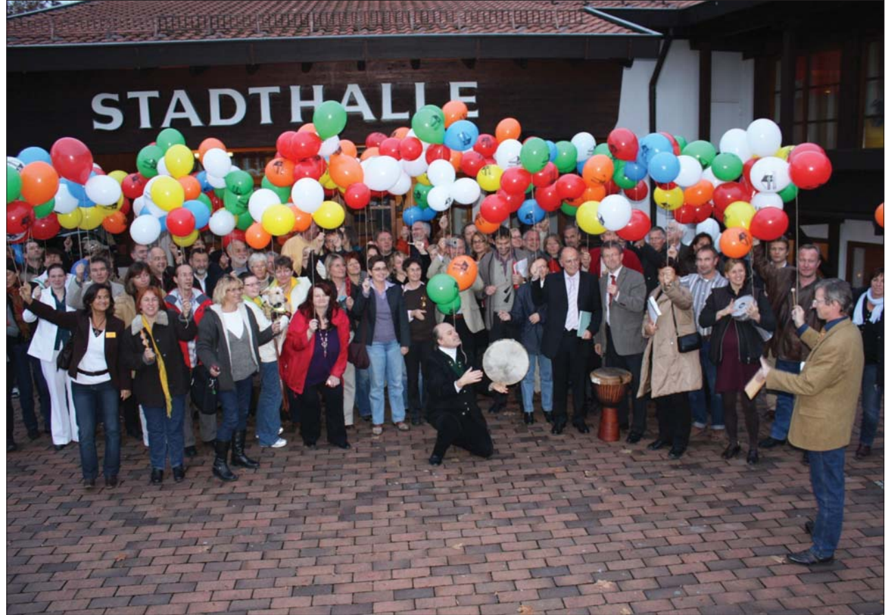
Am Ende der Veranstaltung verabschiedeten die Vertreterinnen und Vertreter der Anbieter sozialer Arbeit die zweite Weilheimer Erklärung. Als Zeichen der Verbundenheit ließ man hunderte bunter Luftballons steigen.