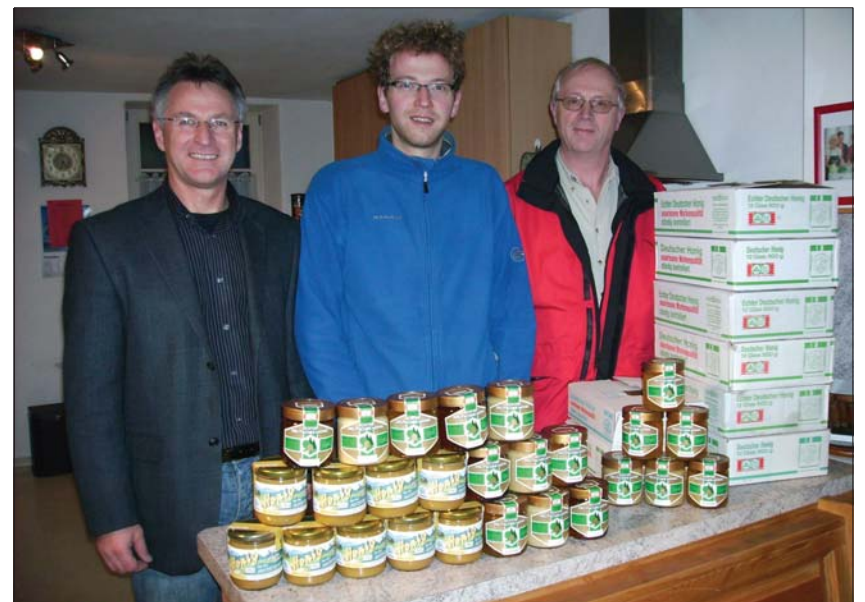
Die Freude bei den Besuchern der Tafel war groß: ein so wertvolles Produkt in hoher Qualität findet sich nicht jeden Donnerstag im Angebot.