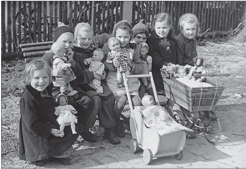
Kriegswaisen fanden bei der Inneren Mission München einen Ort der Zuflucht

Der Festakt findet am 11. Oktober im Saal des Alten Rathauses statt. Als Festredner hat der Ratspräsident der Evangelischen Kirche in Deutschland, Bischof Wolfgang Huber, sein Kommen zugesagt. Unmittelbar daran schließt sich dann die letzte Veranstaltung im Zusammenhang mit dem Gründungsjubiläum an: Bei einer Tagung in der Evangelischen Akademie in Tutzing diskutieren Mitarbeitende und Fachleute über praktizierte Nächstenliebe im Christentum und Islam. kh/dr