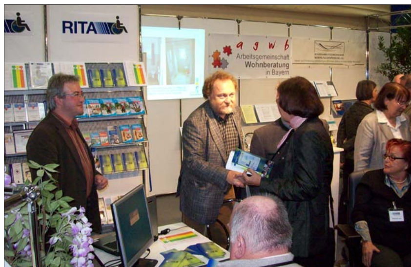
Das Herzogsägmühler EU-Team präsentierte seine Arbeit auf der b-free Messe in Augsburg