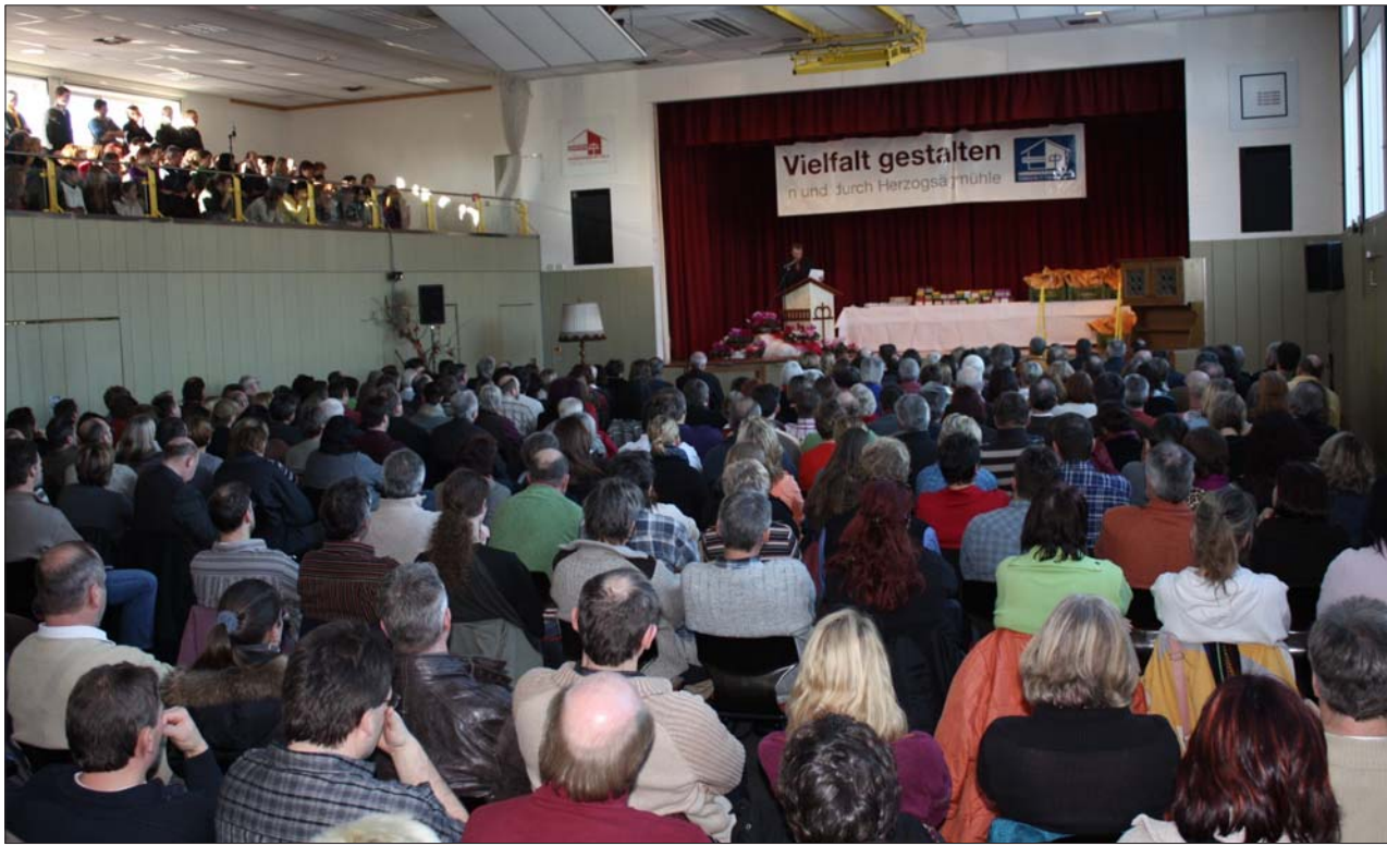
Einen Ausblick auf das Jahr 2009 bekamen die Mitarbeitenden bei der traditionellen Jahresversammlung in der Deckerhalle