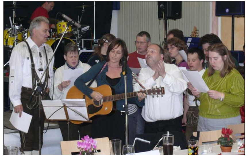
Umjubelter Auftritt des Werkstattchores bei der 30-Jahrfeier