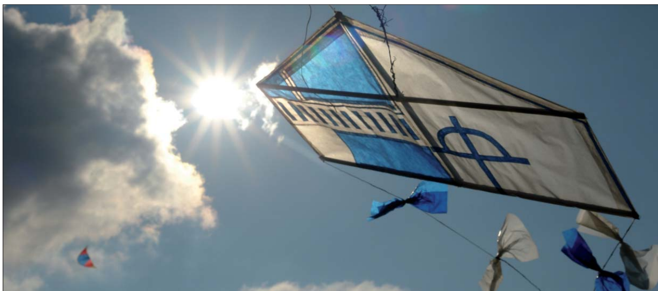
Mehrere Herbstabende verbrachten Hilfeberechtigte und Mitarbeitende damit, die schönen bunten Drachen zu basteln; groß war die Freude, als sie dann am Himmel über Herzogsägmühle zu sehen waren

Abgerundet wurde die Veranstaltung durch live Musik der Trommelgruppe „Fume Fume“ und Bratwurst vom Grill,