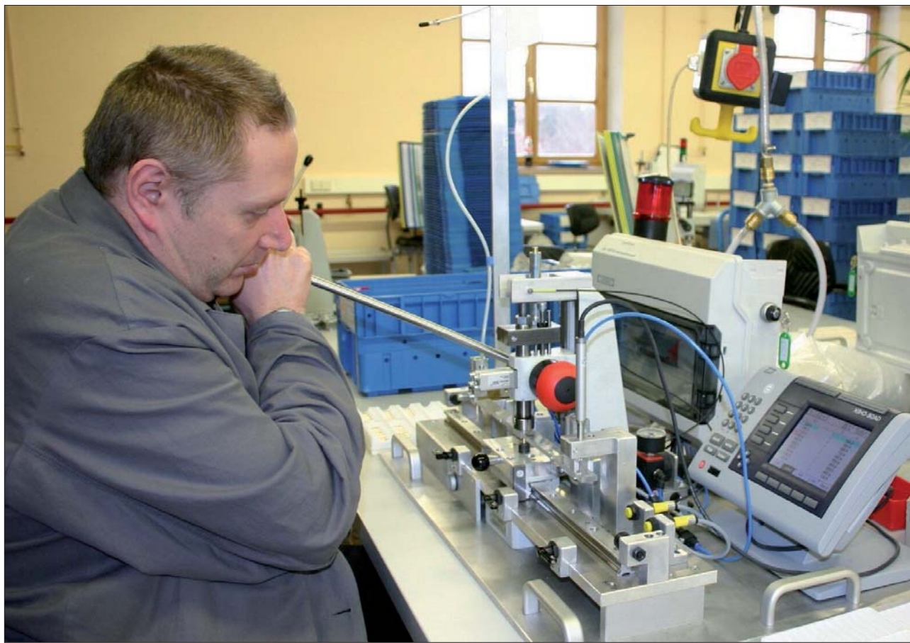
In den vergangenen Jahren hat sich die Arbeit, die in der Werkstatt für Menschen mit Behinderung geleistet wird, grundlegend geändert - von einfachen Tätigkeiten hin zu hochtechnisierten Arbeitsplätzen