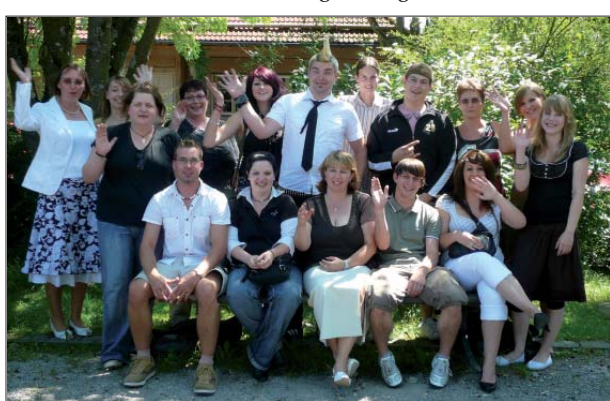
Abschlussklasse der Heilerziehungspflegehilfe

Es war eine Zeit der Auseinandersetzung mit den Unterrichtsfächern: Pädagogik, Heilpädagogik und Psychologie, Medizin und Psychiatrie, Recht und Verwaltung, Praxis- und Methodenlehre mit Kommunikation, Lebenszeit- und Lebensraumgestaltung (Musik, Gestaltung, Spiel,