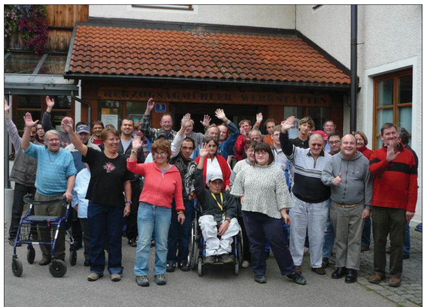
Arbeit als Teil des Lebens - für Menschen mit Behinderung in Herzogsägmühle seit 30 Jahren Alltag

tigung mit leistungsgerechtem Arbeitsentgelt sowie Weiterentwicklung der Persönlichkeit oder auch die Förderung des Übergangs geeigneter Personen auf den allgemeinen Arbeitsmarkt – das sind die auch in Herzogsägmühle verankerten Zwecke der Werkstätten. Erfüllt werden diese gegenüber Menschen mit Behinderung, die in das Arbeitsleben eingegliedert werden und am Arbeitsleben teilhaben