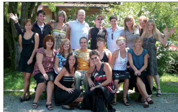
Abschlussklasse der Heilerziehungspflege

Nun sind alle Prüfungsteilnehmer stolz darauf, dass sie die Ausbildung durchgehalten haben. Und