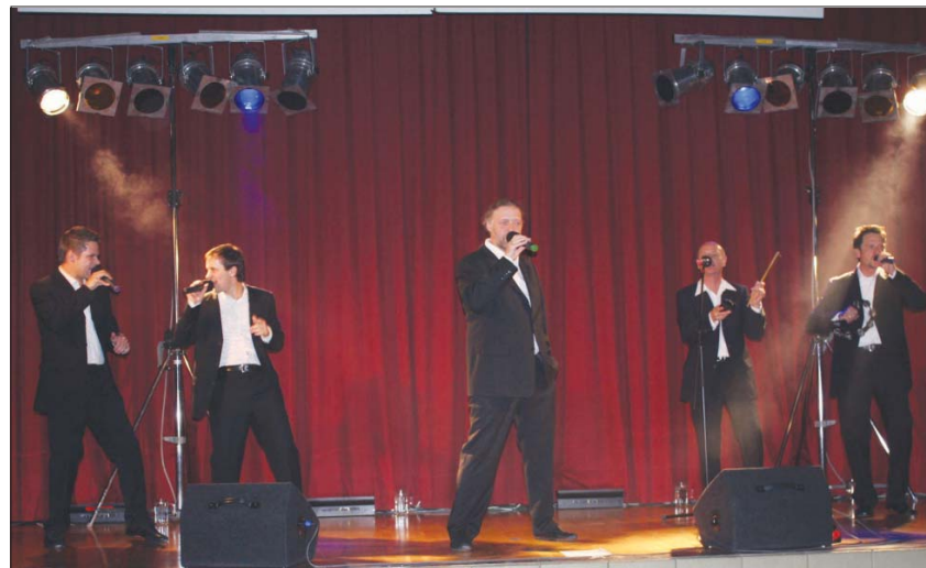
Die Gruppe in-Voice begeisterte die Besucher beim Eröffnungskonzert

Einen bunten musikalischen Regenbogen spannte die gleichnamige Gruppe aus Schongau über Herzogsägmühle. Zum Abschluss der zehntägigen Kulturtag waren sie der Einladung in das Diakoniedorf gefolgt, gestalteten den Gottesdienst und eine anschließende Matinee. Ob geistliche Lieder während des Gottesdienstes oder Lieder aus aller Welt im Anschluss - Regenbogen sang und spielte mitreißend und in musikalisch anspruchsvoller Art und Weise. sk