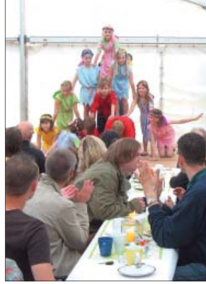
Die Kinderakrobatik fand ein begeistertes Publikum