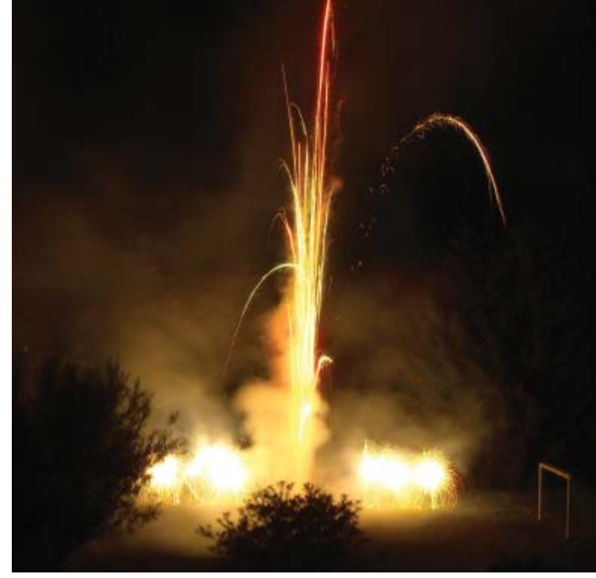
Ein Feuerwerk als Abschluß des gelungenen Jubiläums

Ein ausdrückliches Dankeschön an dieser Stelle an alle, die hierbei geholfen, unterstützt, gespendet und mitgewirkt haben!