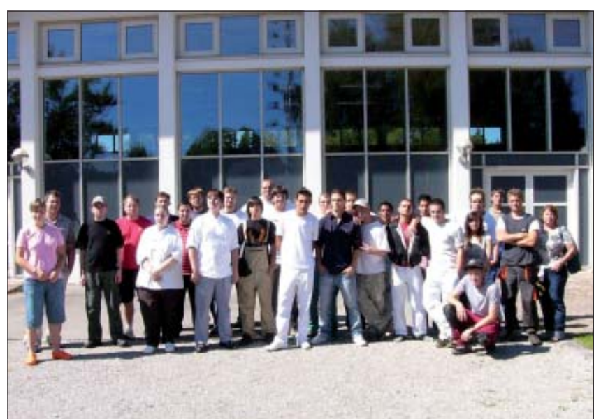
35 von insgesamt 105 Lehrlingen, die in Herzogsägmühle eine Ausbildung machen.