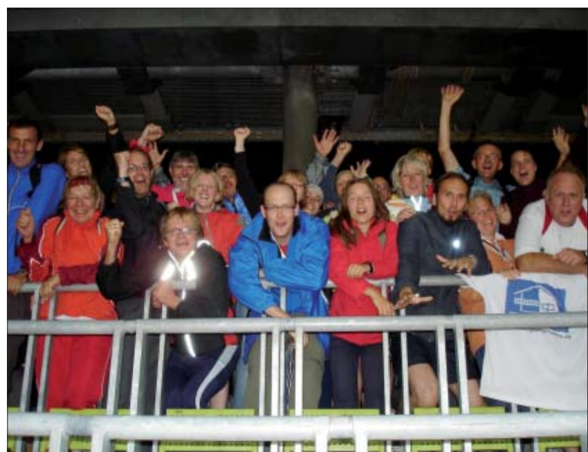
Hoch motivierte Läuferinnen und Läufer aus Herzogsägmühle nahmen am Münchener Firmenlauf teil.