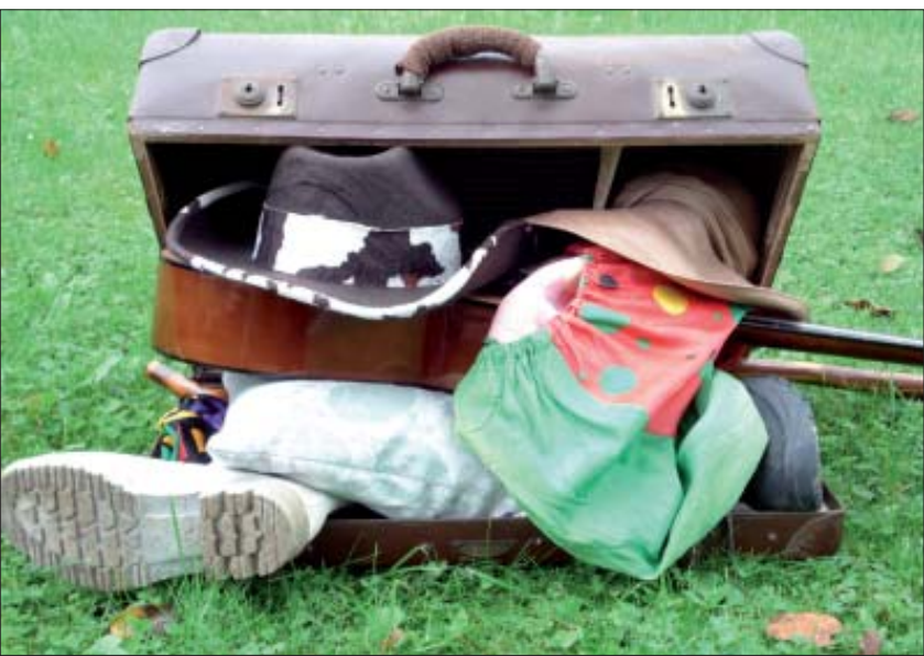
Der Herzogsägmühler Reisekoffer war mit dem Freizeit- und Bildungswerk viel unterwegs: Im Winter kann er mit seinen Eindrücken die Erinnerungen an die Toskana, Griechenland und Ausflüge ins Allgäu wach halten.