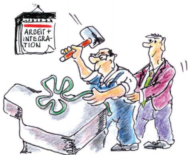
Ein Cartoon von Hubert Pfeffer

Jahresversammlung der Herzogsägmühler Werkfeuerwehr: