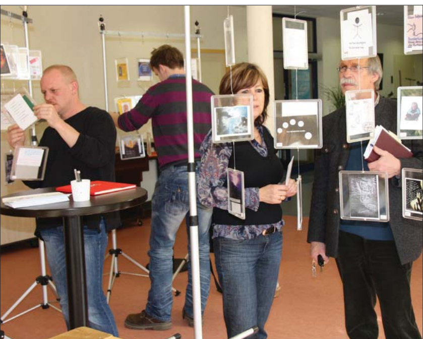
Betroffenheit herrschte bei den Besuchern der Ausstellung über Kindesmissbrauch