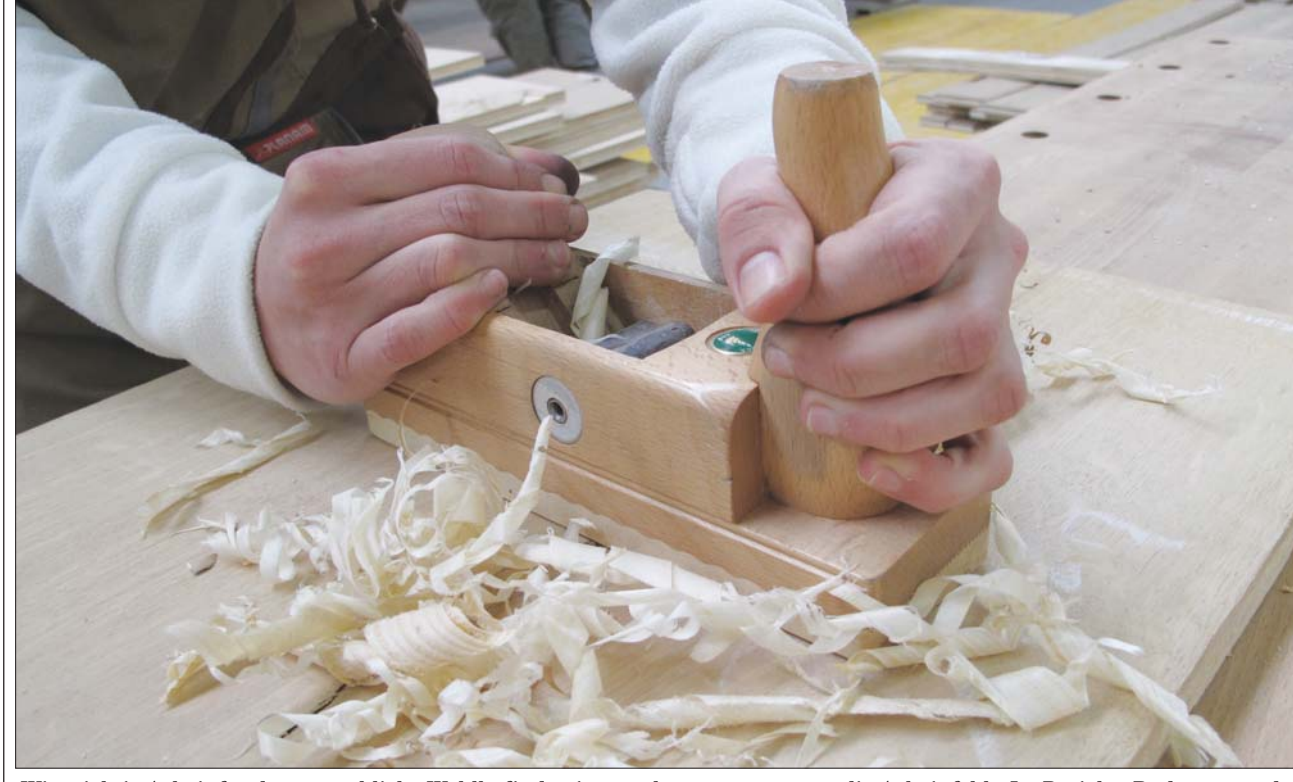
Wie wichtig Arbeit für das menschliche Wohlbefinden ist, merkt man erst, wenn die Arbeit fehlt. Im Projekt „Boden unter den Füßen“ der i+s Pfaffenwinkel GmbH bieten die Mitarbeitenden eine Rundumbetreuung, bevor die meist jungen Langzeitarbeitslosen mit Perspektive in eine Ausbildung oder das Berufsleben starten können. Dabei werden betriebliche Aspekte genau so geschult, wie das Einkaufen und Kochen, einen Haushaltsplan aufstellen oder Schulden abzubauen.