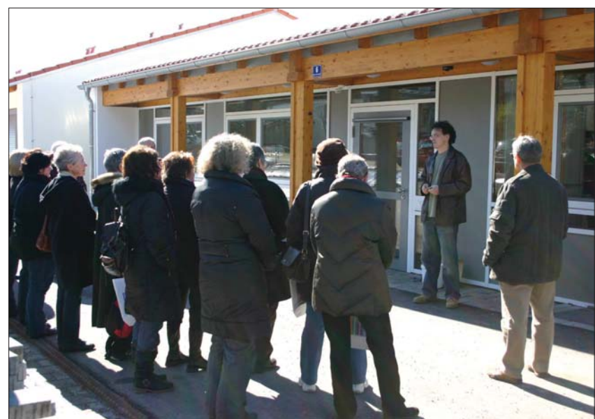
Nachdem die Ehrenamtlichen sich an einem Frühstücksbuffet stärken konnten und viele interessante Neuerungen über Herzogsägmühle erfahren hatten, wurden sie durch die im Herbst vergangenen Jahres eröffnete Rehabilitationseinrichtung für Jugendliche mit psychischer Erkrankung geführt

Den Gästen wurde an diesem Vormittag nicht nur etwas für den Gaumen und die Ohren geboten - der neue Herzogsägmühler Informationsfilm, der in Eigenregie über zwölf Monate hinweg gedreht wurde, bot Einblick in das Leben und Denken von Hilfeberechtigten sowie in die Arbeit von Herzogsägmühle.