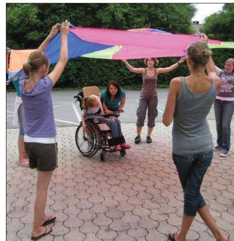
Die Konfigruppe der Kirchengemeinde Peiting-Herzogsägmühle 2011 - Inklusion oder Integration?

Ich schaue auf unsere Kirchengemeinde und versuche die Begriffe Inklusion und Integration in den kirchlichen Alltag zu übertragen. Als christliche Gemeinde wollen wir immer offen für alle Menschen sein. Wir tun das, weil Jesus alle Menschen zu sich gerufen hat. Für ihn gab es nur eine Definition: „Alle Menschen sind Kinder Gottes“. Doch nicht jeder fühlt sich von Jesu Botschaft eingeladen und nicht jeder kann selber kommen, sondern