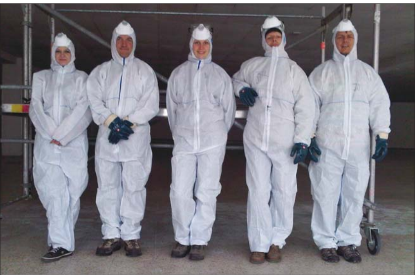
Nur mit Schutzanzügen war es möglich, alte Materialien aus dem Gebäude zu entfernen

Am 27. Mai 2011 wird BiLL – das soziale Kaufhaus in Landsberg offiziell eröffnet. Bis dahin gibt es auch noch einiges zu tun, aber das Team von BiLL freut sich schon darauf, Sie in unserer Eröffnungswoche beim Stöbern oder Einkaufen zu begrüßen. bsch