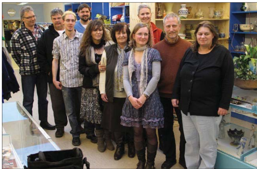
Das Team der Penzberger Schatzkiste freut sich auf interessierte Kundschaft

Herr S.: „Ich habe hier viele soziale Kontakte und eine schöne Aufgabe, die mir die nötige Struktur gibt. Ich kann mich in einem geschützten Raum bewegen und mich persönlich entwickeln. Ich habe gute Kollegen, es ist schön hier zu arbeiten und ich verdiene mir sogar noch etwas dazu.“ ckh