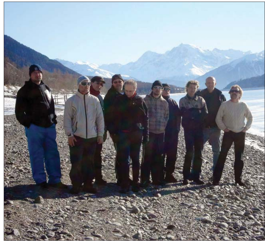
Die begeisterten Sportlerinnen und Sportler im Graswangtal

Und eine großartige Gruppe, mit der alles ganz einfach war: Extraklasse!