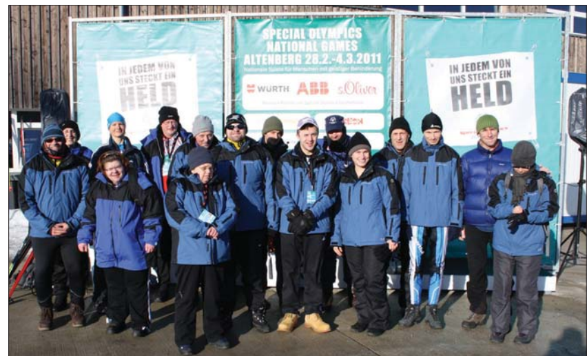
Dabei sein ist alles: Die Sportlerinnen und Sportler der Herzogsägmühler Werkstätten bei den Special Olympics in Altenberg